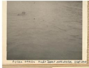
HALO- FREE FALL

La Helicoportada tenía asignados 10 Helicópteros, 6 de transporte y 4 artillados, tripulados por la Fuerza Aérea ya que el Ejército no tenía pilotos ni técnicos para tal fin