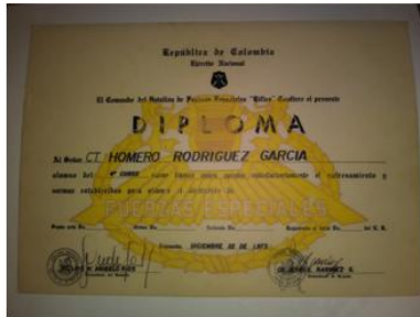
9 CURSOS DE FFE