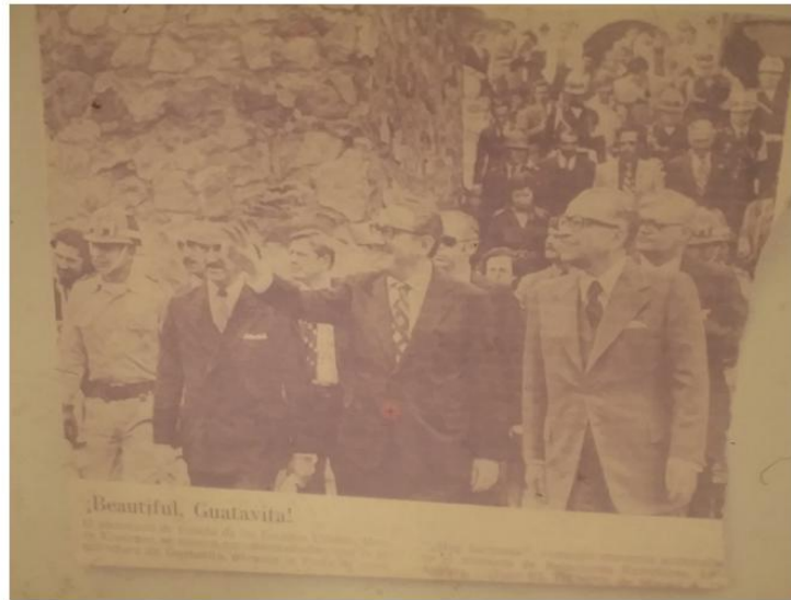
MR HENRY KISSINGER SECRETARIO ESTADO USA - GUATAVITA 1972

Dentro de las misiones asignadas en Contrterrorismo Operaciones protectivas cubrimos la Visita del Dr Henry Kissinger Secretario de Estado de los Estados Unidos a Bogotá y Guatavita estas técnicas las aplique más tarde a mi regreso de la Academia Nacional del FBI en Quántico para la organización de lo correspondiente a las Escoltas Militares en el Comando General y más tarde (Entre 1994 y 2013 Asesore al mando y capacité más de 4000 escoltas para las FFMM, Policía, Fiscalía y Procuraduría) y de países amigos con la ESICI, OPSIC y ESPOM entre otros Argentina, Brazil, Chile, Costa Rica, Ecuador, Perú, Bolivia