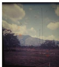
MAIL PICK UP

-En 1971 mediante Disposición 00411 , Artículo 86 del decreto Ley 8081 se crearon las Fuerzas Especiales con base en el Rifles, Guardias de Honor del libertador en el Fuerte de Tolemaida.